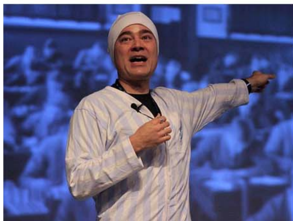
Diretor de Mobilidade e Desenvolvimento de negócios da Wikimedia Foundation/Wikipedia